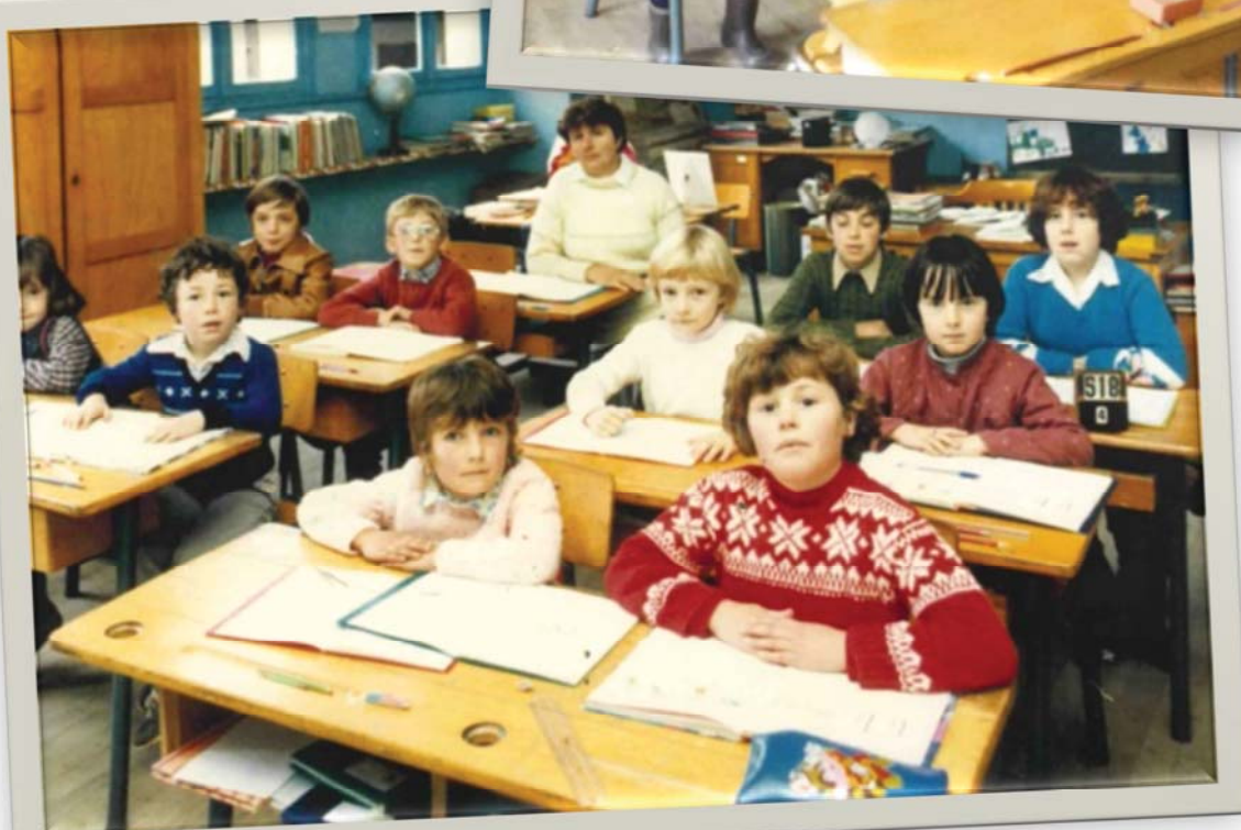
EN 1980 AVEC MME SEGERIE