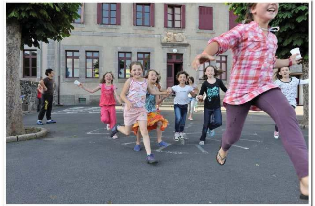
Lors de la récréation...

Bien sûr, durant la journée, les enfants disposent de plusieurs récréations pendant lesquelles ils ne manquent pas de s'amuser !