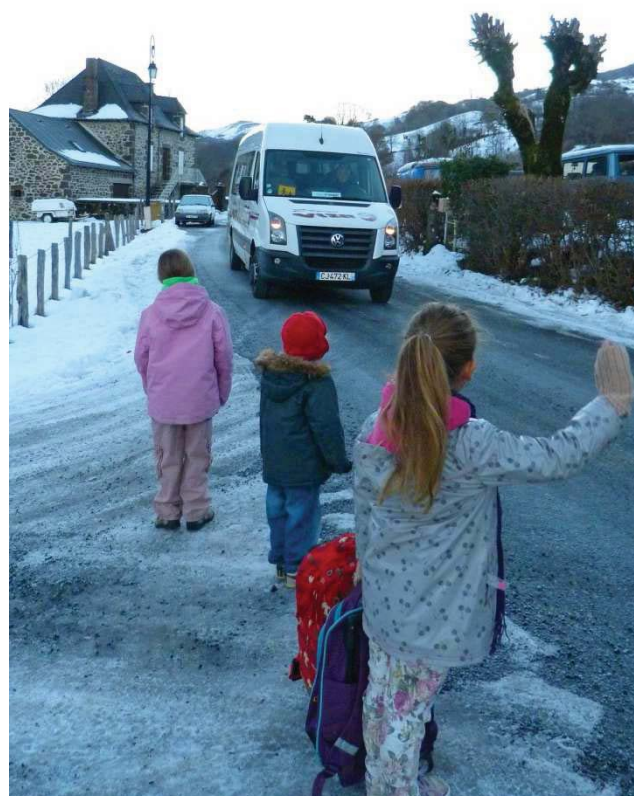
L'arrivée du bus

Le bus vient chercher les enfants devant chez eux et passe sur la place du village à 8h15. Les enfants arrivent donc à l'heure à l'école de Saint Chamant pour débiter les cours à 9h. Le soir peu après 16h30, le bus vient chercher les enfants pour les ramener chez eux à St Projet. Dix enfants sont conduits chaque jour à Saint Chamant parmi les 14 inscrits.