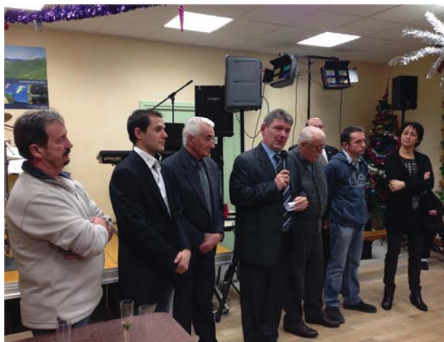
Le discours du Maire

Un verre de l'amitié a ensuite été servi et l'après-midi s'est poursuivie autour des bûches de Noël, galettes... et par le traditionnel service de la soupe au fromage.