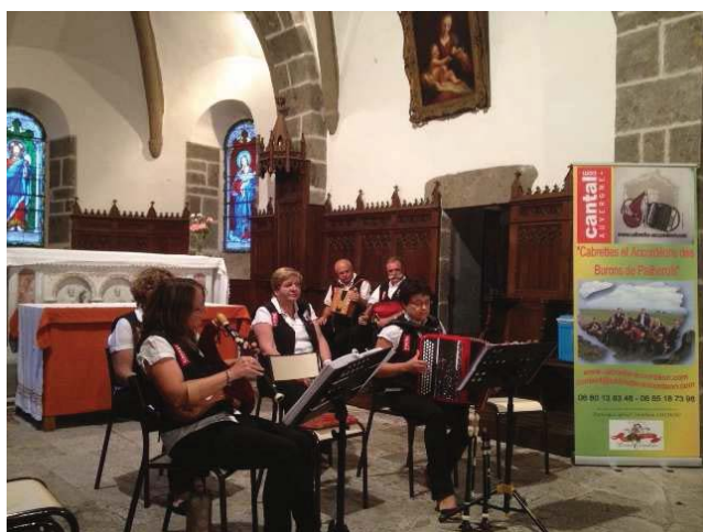
Cabrettes et accordéons des burons de Pailherols

Après 1h45, le public en demandait encore pour la plus grande joie des musiciens et chanteurs. La soirée se termina autour d'un succulent repas dans une ambiance fort agréable.