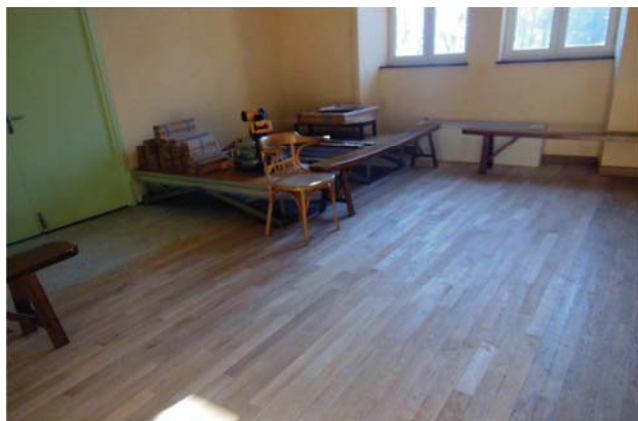
Le parquet de la salle en cours de pose

Suite à d'importants dégâts causés par une infiltration d'eau dans la salle polyvalente, le parquet sur une large moitié de la salle a dû être repris. C'est Mr Hutinet, menuisier, qui s'est chargé de la réalisation des travaux. Pour information, le montant s'élève à 5 300 € entre l'achat du bois et le travail de pose. Cette somme est prise en charge par la compagnie d'assurance des suites du dégât des eaux.