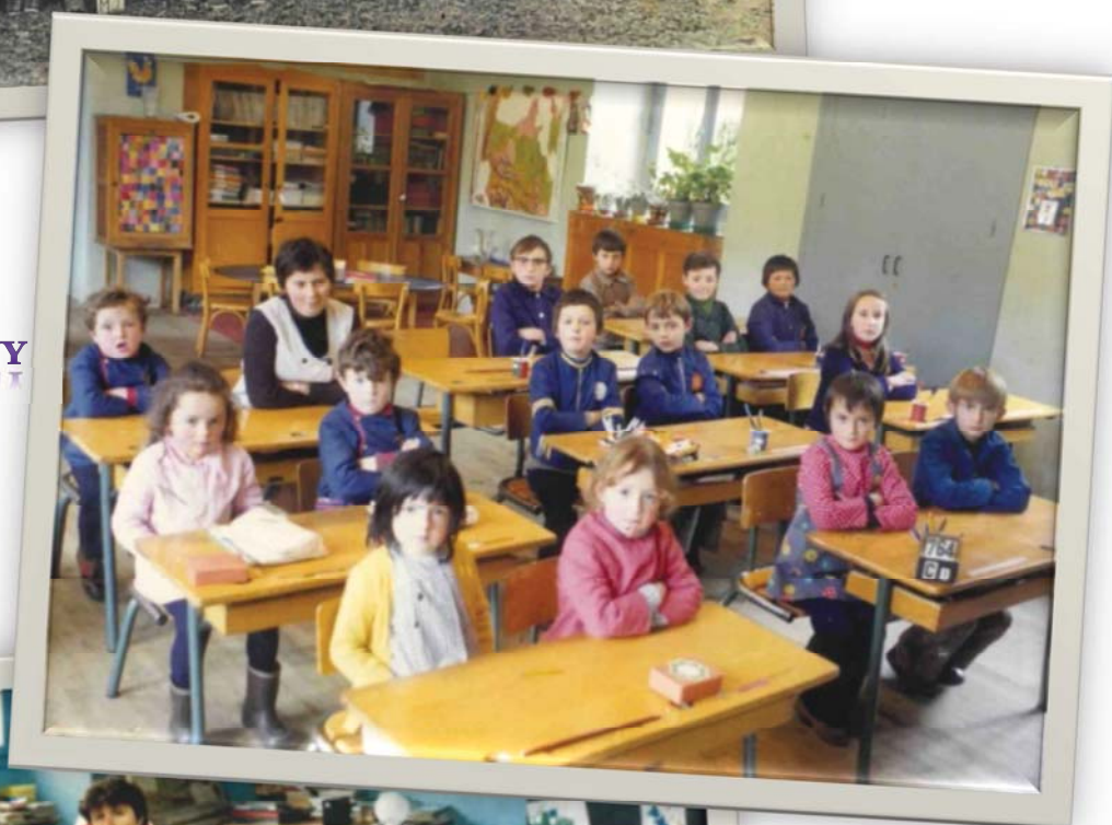
EN 1975 AVEC MME JOANNY