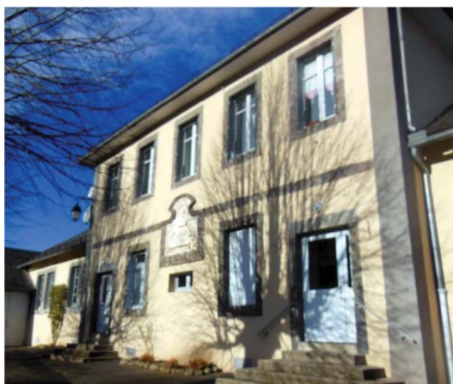
Vue actuelle du bâtiment des écoles de St Projet

Ces deux bâtiments appartenaient bien évidemment à la commune, et c'est toujours le cas.