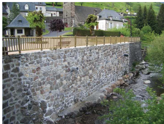
Vue sur le mur refait à neuf

Aujourd'hui, la place du village dispose donc d'un solide mur refait à neuf. Pour compléter ces travaux de reconstruction la barrière dans sa partie abîmée a été remplacée et de la castine a été remise sur la place. Ainsi, la place du village retrouve son aspect original.