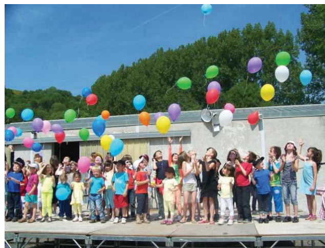
Le lâché de ballon lors de la fête

Puis, tous ont lâché un ballon espérant que les messages portés soient lus et que des nouvelles leur arrivent en retour.