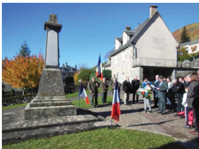
Devant le Monument Aux Morts, sous un ciel radieux