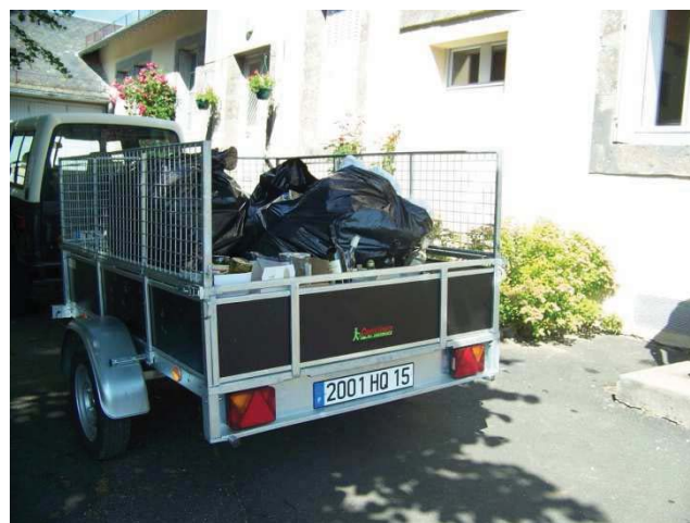
La remorque en cours d'utilisation