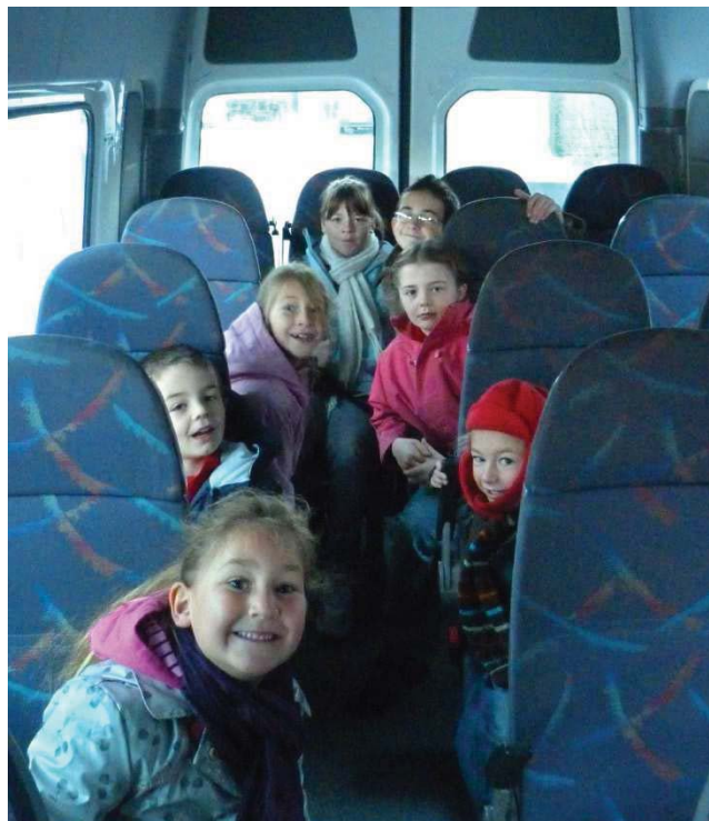
Une partie des enfants dans le bus

Globalement, il faut savoir qu'au niveau de la Communauté de communes, le coût du transport scolaire représente une charge importante pour la collectivité qui est notamment de l'ordre de 500 000 €, soit 1 300 € par enfant en moyenne.