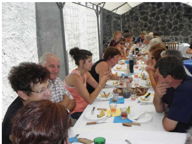
Le banquet des Amis de Lapeyre St Dolus

Les membres de l'association remercient Mr le Maire de s'être rendu disponible pour venir saluer tout le monde !