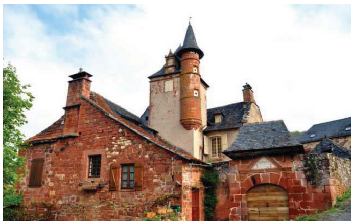
Collonges la Rouge

Le voyage du Club des Aînés de la Bertrande s'est déroulé mercredi 26 juin dernier. La destination retenue était celle de Collonges la Rouge dans le département de la Corrèze, classé dans les plus Beaux Villages de France. Partis avec les transports VIZET, les 30 voyageurs ont pu découvrir la beauté de la ville et des alentours, avec notamment la visite de deux châteaux. Un bon repas à midi a permis à chacun de prendre des forces avant de regagner le Cantal.