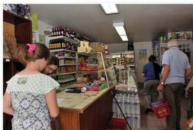
Vue du magasin avec ses clients...

Pour les commandes de pain, les réservations sont à faire à l'épicerie ou bien par téléphone au 04.71.68.54.88