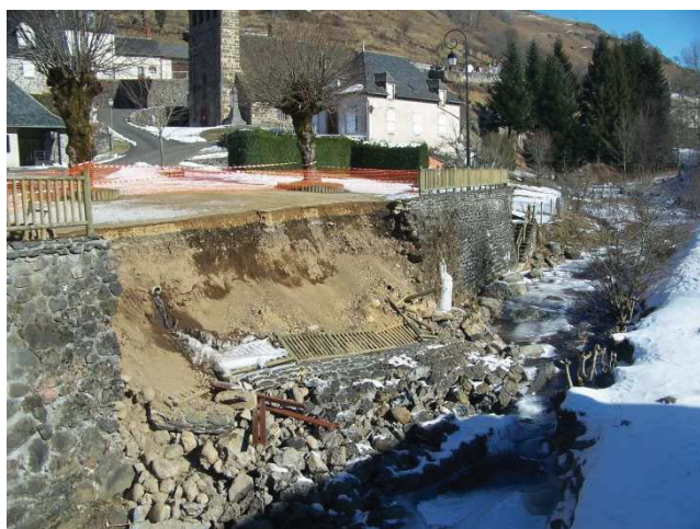
Le mur écroulé