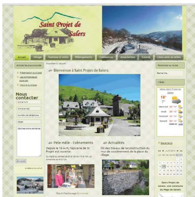
Aperçu de la page d'accueil du site