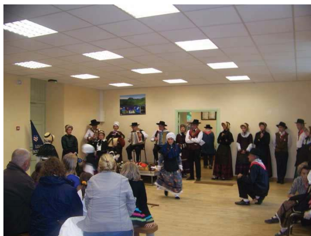
La Compagnie des Bouscas en représentation

L'après-midi fut plus complexe du fait d'une météo capricieuse, obligeant à organiser la représentation des Bouscas à la salle polyvalente, mettre fin au vide grenier et annuler les jeux prévus pour les plus jeunes.