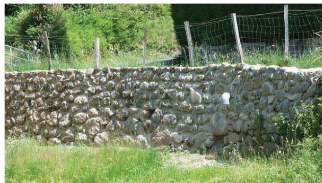
Le mur sous la route de Conches

La partie du mur écroulée soutenant la route dans le village de Conches a été refaite cet été. L'entreprise de travaux publics Garcelon s'est occupée du chantier de maçonnerie.