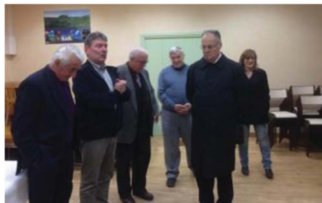
Visite de l'évêque